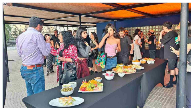
Los asistentes a la Avant premiere pudieron disfrutar de un coctel después de la función, con la posibilidad de interactuar con el director y los actores.