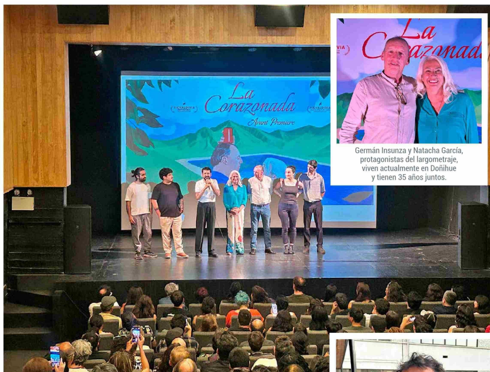
Previo a la proyección, el director junto al elenco agradeció a los asistentes.