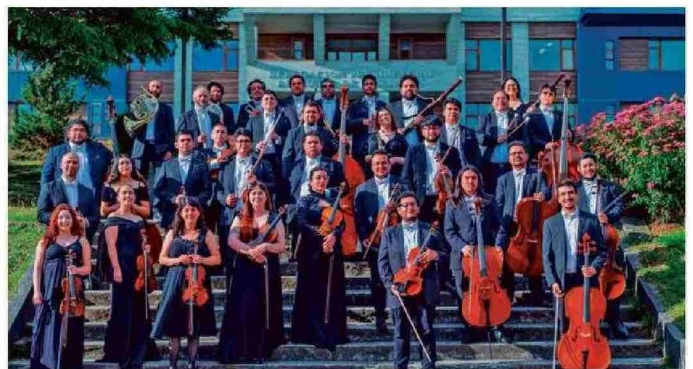
Orquesta de Cámara de Puerto Montt.