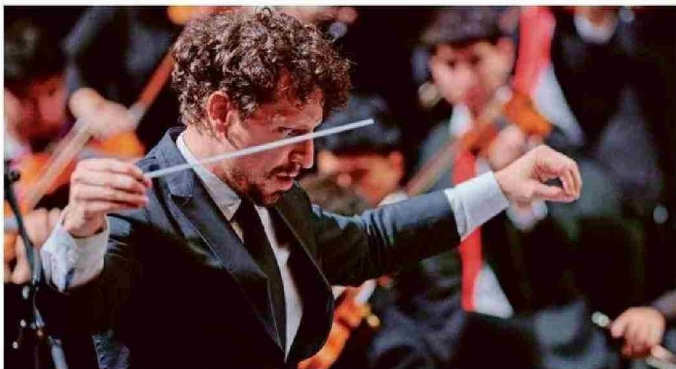
Paolo Bortolameoli dirigirá la Orquesta Sinfónica Nacional Juvenil.

Otro aspecto a reforzar con miras a las seis décadas de este festival musical es "que a pesar de que la música contemporánea no es gusto de todo el mundo, tenemos una responsabilidad de ser vitrina de los compositores contemporáneos. Entonces, siempre nuestra programación va a ser una mezcla del clásico con el contemporáneo".