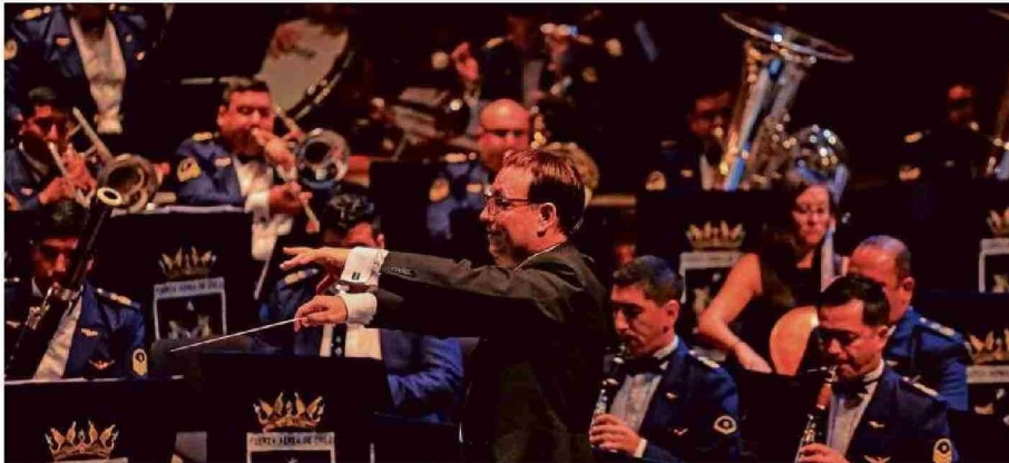
Banda Sinfónica FACH.