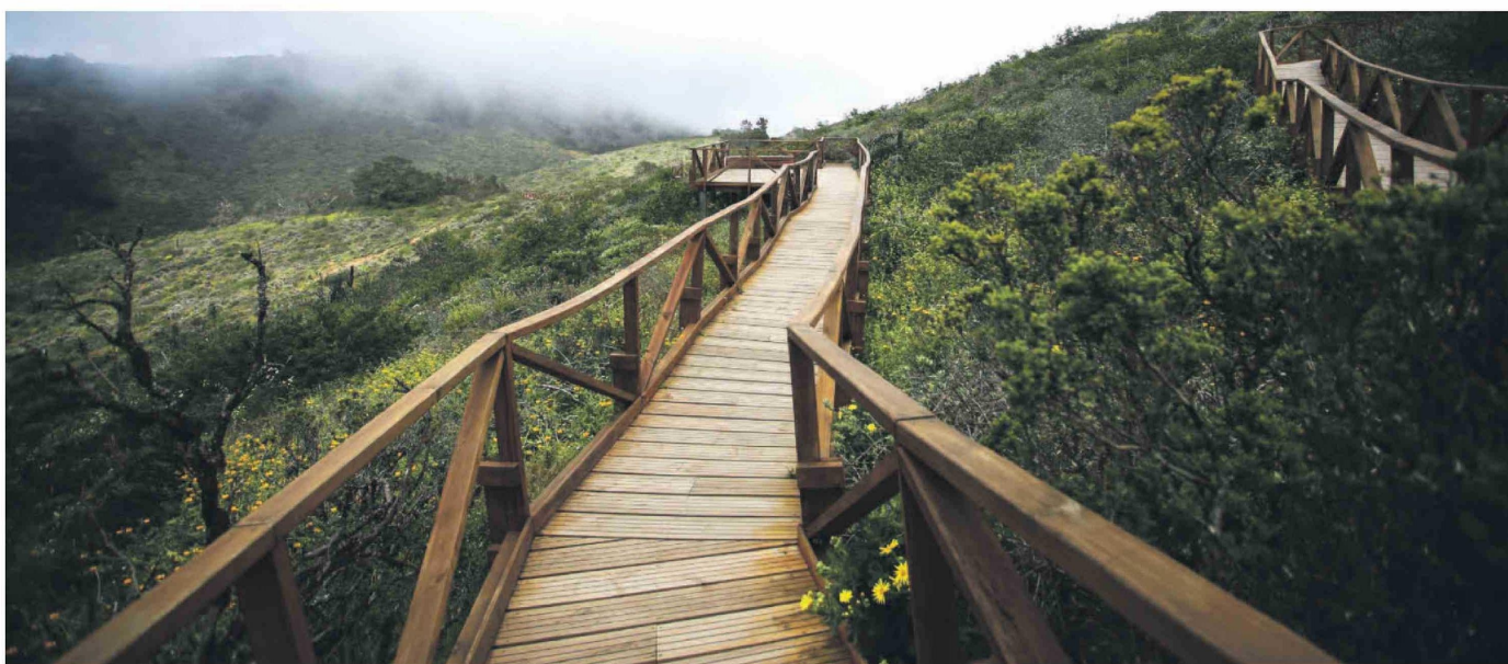
El Parque Nacional Fray Jorge es uno de los principales atractivos turísticos de Ovalle, reconocido por su biodiversidad y valor internacional.

La comuna de Ovalle se posiciona como un territorio con una amplia diversidad de atractivos turísticos que combinan naturaleza, historia y tradiciones. Ubicada en el corazón del valle del Limarí, ofrece rutas accesibles y señalizadas que permiten recorrer distintos puntos de interés, tanto desde el norte como desde el sur de la región.