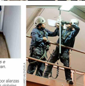
El modelo de atención de Metrowan también rompe el molde, poniendo al cliente en el centro del negocio.

anticipándose a fallas y brindando atención inmediata. Esta proactividad y cercanía han sido