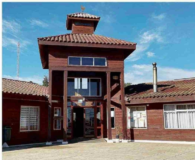
LA MUNICIPALIDAD DE EL TABO INVESTIGA A 18 FUNCIONARIOS QUE HABRÍAN REPETIDO SUS FALTAS.

El jefe comunal explicó que "no se trata de 35 personas distintas", sino de un grupo reducido de trabajadores que repiten