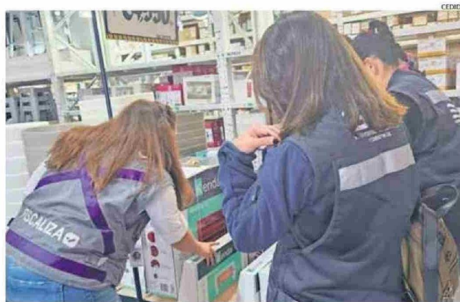
FUNCIONARIOS DE SERNAC Y LA SEC FISCALIZANDO LA VENTA DE ESTUFAS EN EL COMERCIO REGIONAL.