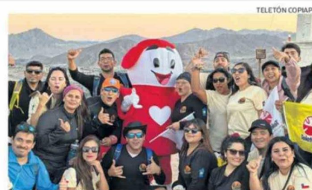
FUE UNA JORNADA MARCADA POR EL DEPORTE, LA INCLUSIÓN Y EL COMPANERISMO.