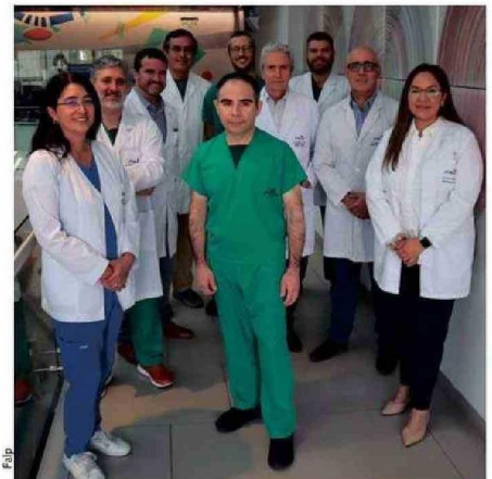
El equipo de tratamiento multidisciplinario de sarcomas FALP está conformado por especialistas en cirugía digestiva, cirugía vascular, cirugía traumatológica, radioterapia, oncología médica y anatomía patológica.

también tienen una alta posibilidad de curarse"