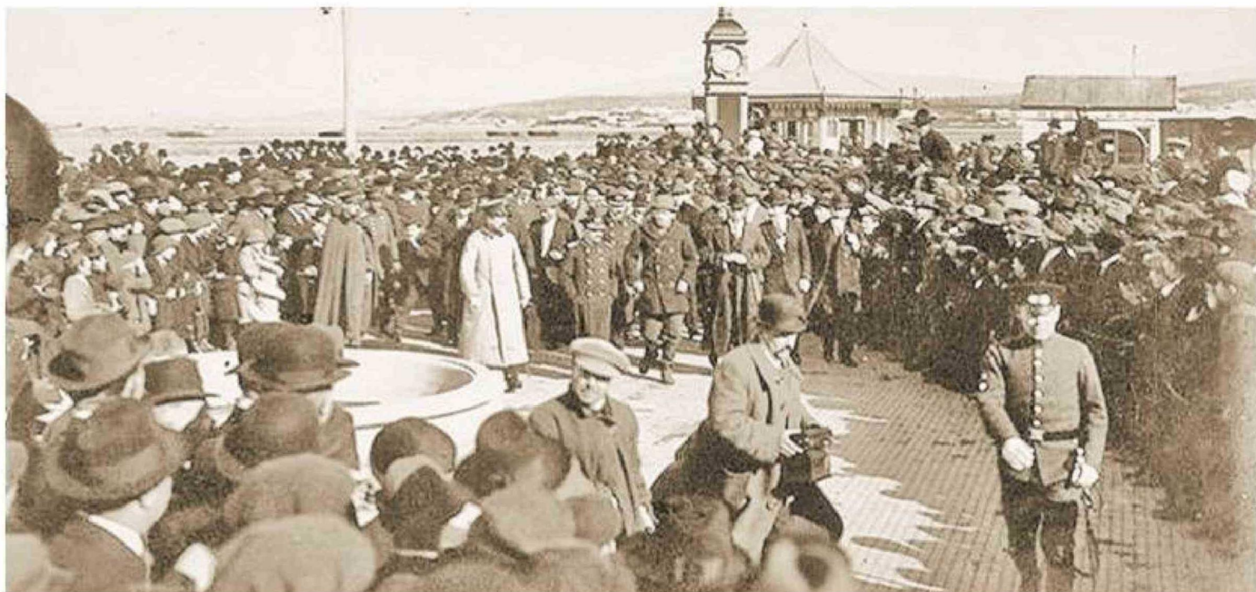
La policía de Carabineros cumpliendo funciones a la llegada de Shackleton al muelle fiscal, en julio de 1916.