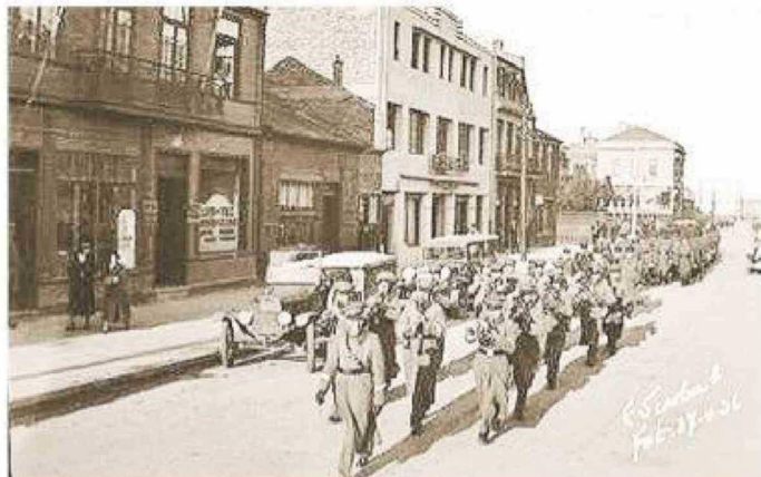
Desfile de Carabineros por calle Bories, en sentido contrario, año 1936, en el Día del Carabinero.

jurisdiccionales de las mismas, tanto en el continente como en Tierra del Fuego.