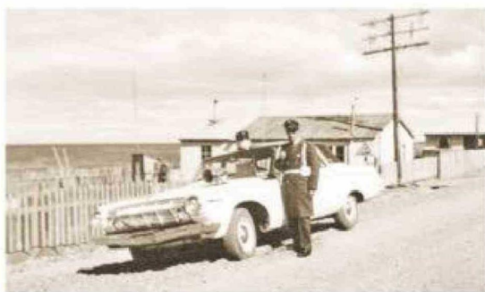
Carabineros en un patrullero Dodge, año 1960.