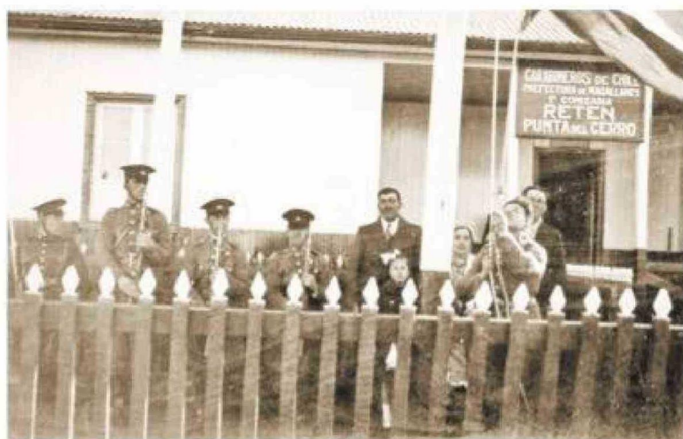
Retén Punta del Cerro, al norte de Punta Arenas.