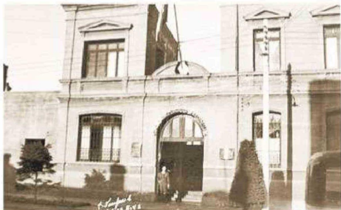
La Comisaría de Carabineros, en calle Waldo Seguel, año 1942.