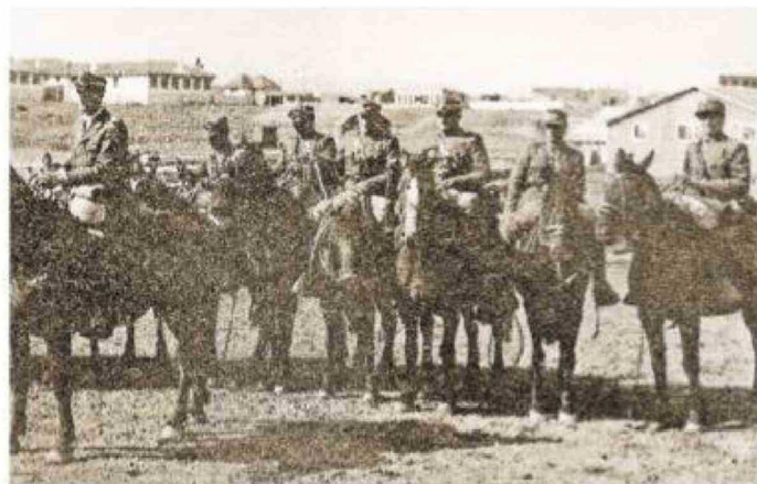
Carabineros a punto de iniciar un arreo de caballares, desde Tierra del Fuego a Coyhaique.

*Fuentes de consulta: Magallania y archivos del autor.