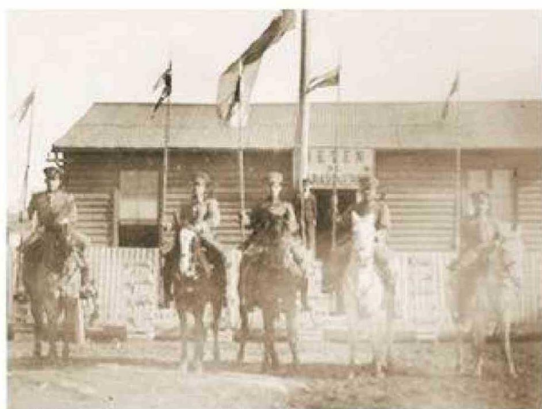
Carabineros de Puerto Harris, isla Dawson, en 1922.

■ Continuos hechos delictuales en el lado argentino, a inicios de la primera década de 1900, determinó la necesidad de disponer de un cuerpo policial que garantizara la tranquilidad y seguridad pública en los sectores urbano y rural.