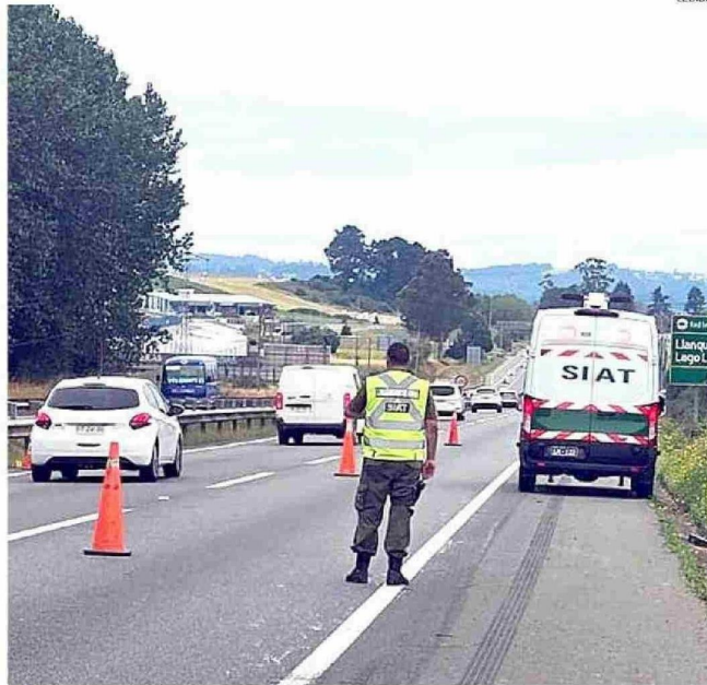
CARABINEROS DE LA SIAT REALIZA LAS DILIGENCIAS PARA ESTABLECER CÓMO SE REGISTRO ESTE HECHO.

VOLOGÍA El accidente ocurrió cerca de las 23:30 horas del jueves. Equipos de emergencia llegaron de madrugada, revisaron el vehículo (marca Lexus) volcado en una zanja y al no encontrar ocupantes, presumieron una fuga.