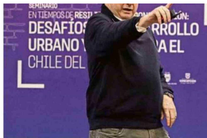
TUVO UN ENTREVERO CON UN ACADÉMICO EN CONCEPCIÓN.