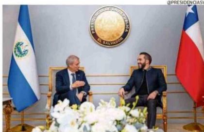
KAST TUVO UNA REUNIÓN BILATERAL CON BUKELE