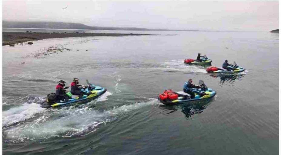
LOS VISITANTES SERIAN DE UN EXCLUSIVO TOUR POR LA PATAGONIA EN ESTE TIPO DE ARTEFACTOS MOTORIZADOS.

Por parte de la Armada de Chile, el gobernador marítimo de Castro, Ricardo Cárcamo, ratificó que a eso de las 8.20 horas de este 21 de enero "el alcalde de mar de Queilen recibe el llamado de que motos de agua ingresaron al islote Conejo, las que no fueron detectables, ya que el llamado fue recibido tarde y también los medios nuestros no estaban disponibles para ese lugar. Sin embargo, estamos ha-