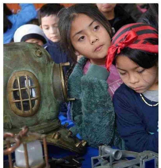
CON CURIOSIDAD PUDIERON PROFUNDIZAR SUS CONOCIMIENTOS EN TORNO AL FASCINANTE MUNDO DEL MAR. ALGUNOS DE ELLOS SEÑALABAN NO CONOCER EL OCEANO PACÍFICO.