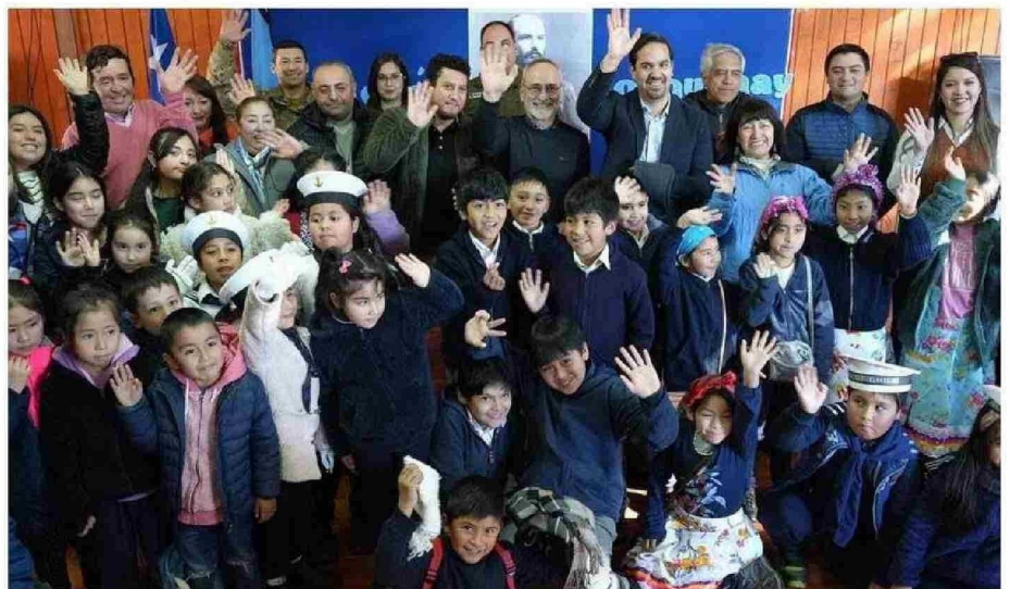
UNA VERDADERA FIESTA DE LA CULTURA EN TORNO AL MAR SE VIVIÓ EN LA COMUNA DE LONQUIMAY.

EL GOBERNADOR APROVECHÓ LA OPORTUNIDAD PARA GENERAR OTROS COMPROMISOS EN BENEFICIO DE LOS NIÑOS DE LOS SECTORES RURALES DE LA COMUNA.