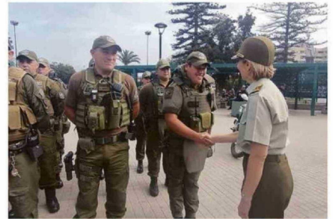
GENERAL VÁSQUEZ LIDERÓ A LA FUERZA POLICIAL.