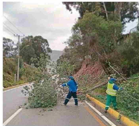
EQUIPOS DE EMERGENCIAS ESTUVIERON EN TERRENO.

tes de luz, porque en el sector se cortó la luz y no porque aquello se relacionara con trabajos que se estén realizando al interior de los establecimientos. Además, se registraron algunas goteras, pero, en gene-