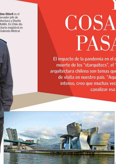
El Museo Guggenheim mostró que un edificio puede transformar la economía de una ciudad. Fue una idea que funcionó en Bilbao, pero que ha fracasado en otros lugares".

La pandemia subrayó la necesidad de que la arquitectura aborde temas como el cuidado y el bienestar de las personas".