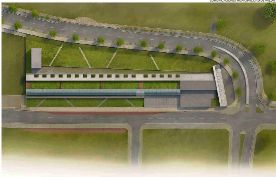
PROYECTO MERCADO ESTACIÓN, IMPULSADO POR LA MUNICIPALIDAD DE VALDIVIA.

se traduce aproximadamente la cartera de proyectos del municipio. Tiene un horizonte de mediano y largo plazo, proyectado hasta el año 2030.