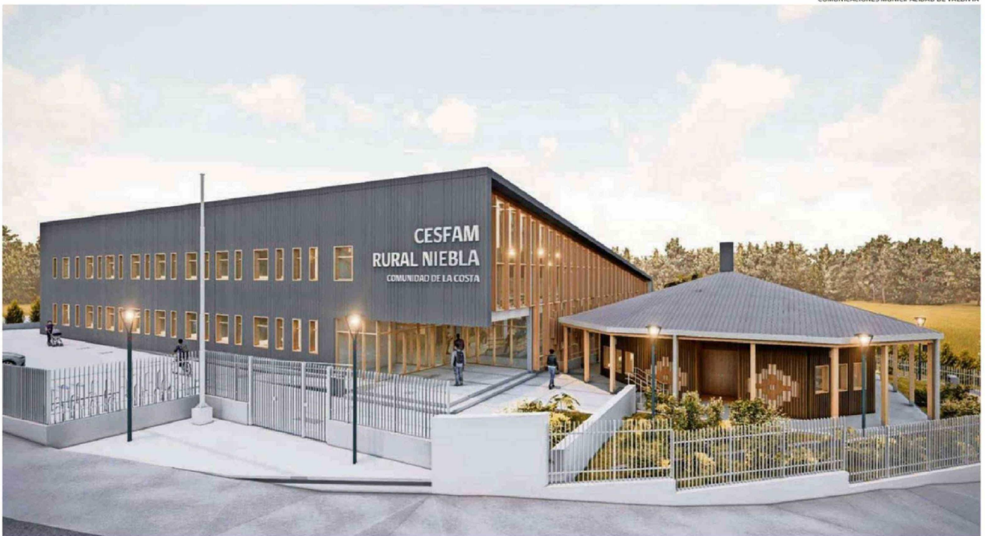
EL MUNICIPIO HA DEFINIDO UNA CARTERA DE 200 PROYECTOS QUE SE BUSCA MATERIALIZAR AL 2030, A TRAVÉS DE DIVERSAS FUENTES DE FINANCIAMIENTO: PROPIAS, SECTORIALES Y DEL GOBIERNO REGIONAL.

COMUNICACIONES MUNICIPALIDAD DE VALDIVIA