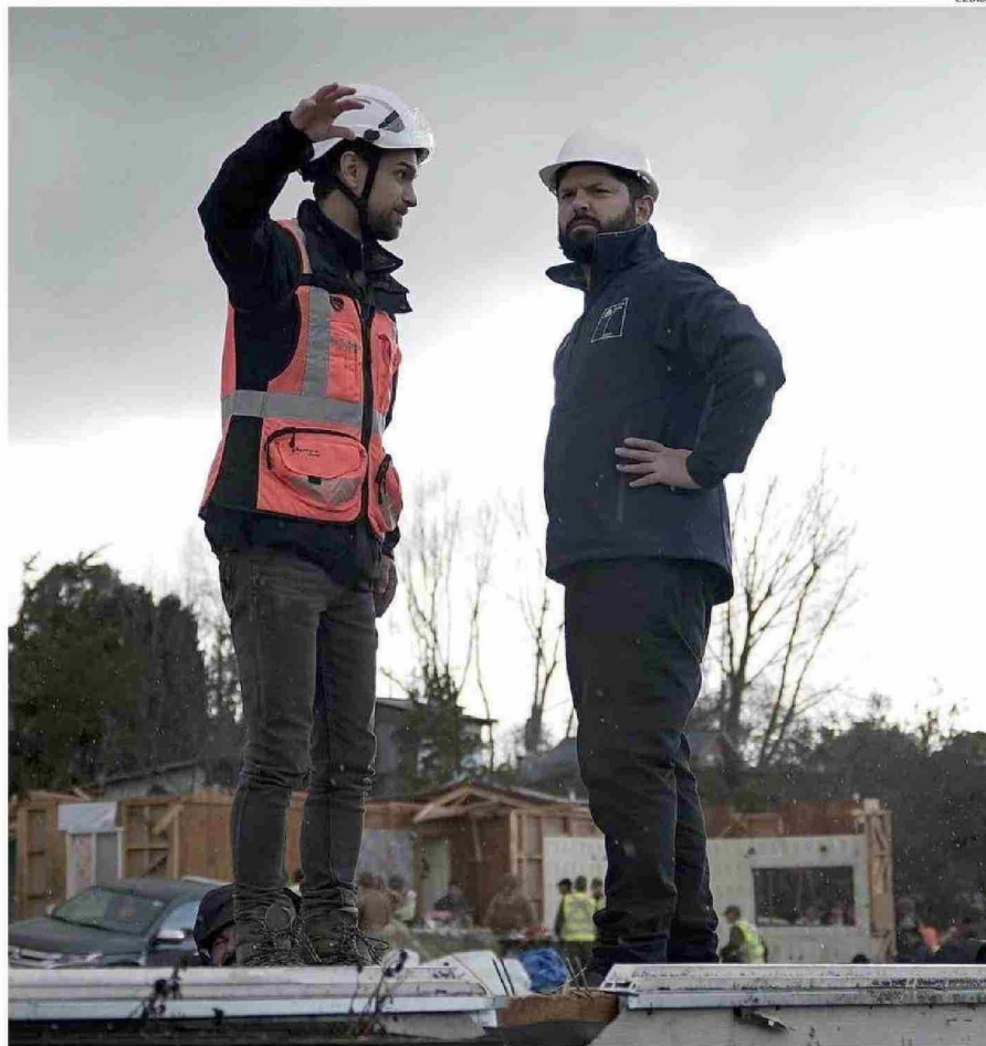
EL PRESIDENTE GABRIEL BORIC SE REUNIÓ CON EL ALCALDE TOMÁS GÁRATE Y PUDO CONOCER EN TERRENO EL DESASTRE DEL DOMINGO.

En calle Del Salvador está la Casa Droppelmann, una de las de mayor data, al ser construida entre 1933 y 1935. Tuvo importantes daños de acuerdo a Claudio Vidal, de la empresa