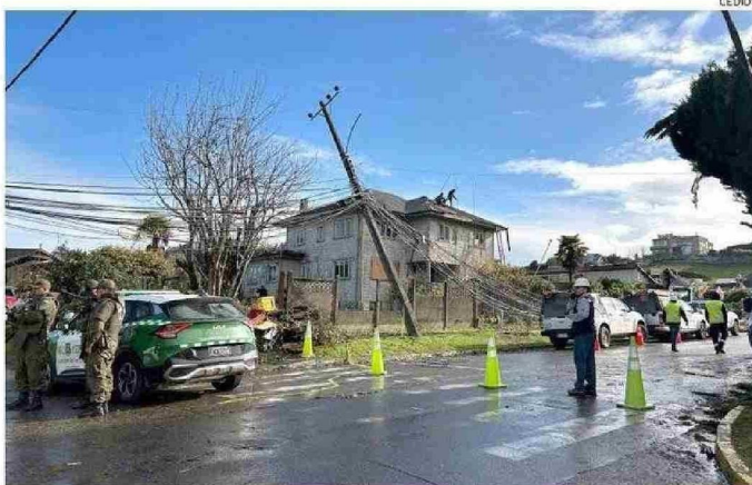
LAS CALLES DONDE HUBO PROBLEMAS SE VAN A MANTENER CERRADAS VARIOS DÍAS.

El diputado y médico dijo además estar preocupado por el posible aumento de enfer-