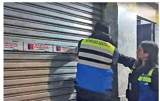
AUTORIDADES Y POLICÍAS DESPLEGARON un amplio operativo en el centro y la Vega Techada, que dejó como resultado clausuras, prohibiciones de funcionamiento y retiro de vehículos.

Las autoridades reiteraron que este tipo de operativos continuará desarrollándose en distintos puntos de la provincia, con el objetivo de reforzar la seguridad, el orden y el cumplimiento de la normativa vigente en espacios de alta actividad comercial.