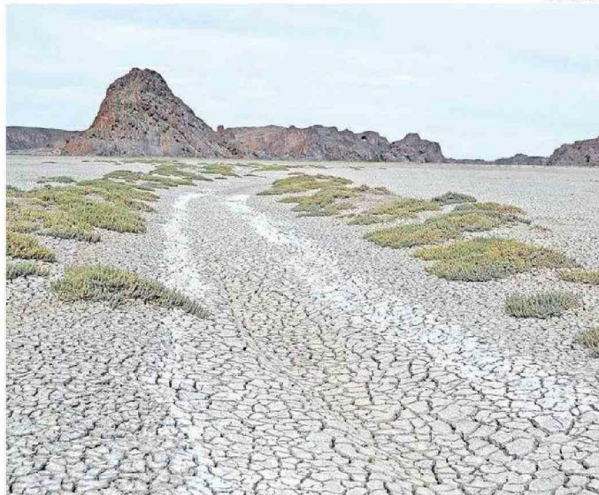
LA EROSIÓN EN LA PATAGONIA ARGENTINA HA PERJUDICADO LOS CULTIVOS.

No obstante aquello, "esta agricultura intensiva se ha centrado en la producción y no en la sostenibilidad. Se basa en fertilizantes, pesticidas y monocultivos", afirmó el docente, lo que "ha llevado a una degradación del suelo, explotación del agua y contaminación del aire", conduciendo a una "depresión de la materia orgánica y pérdida