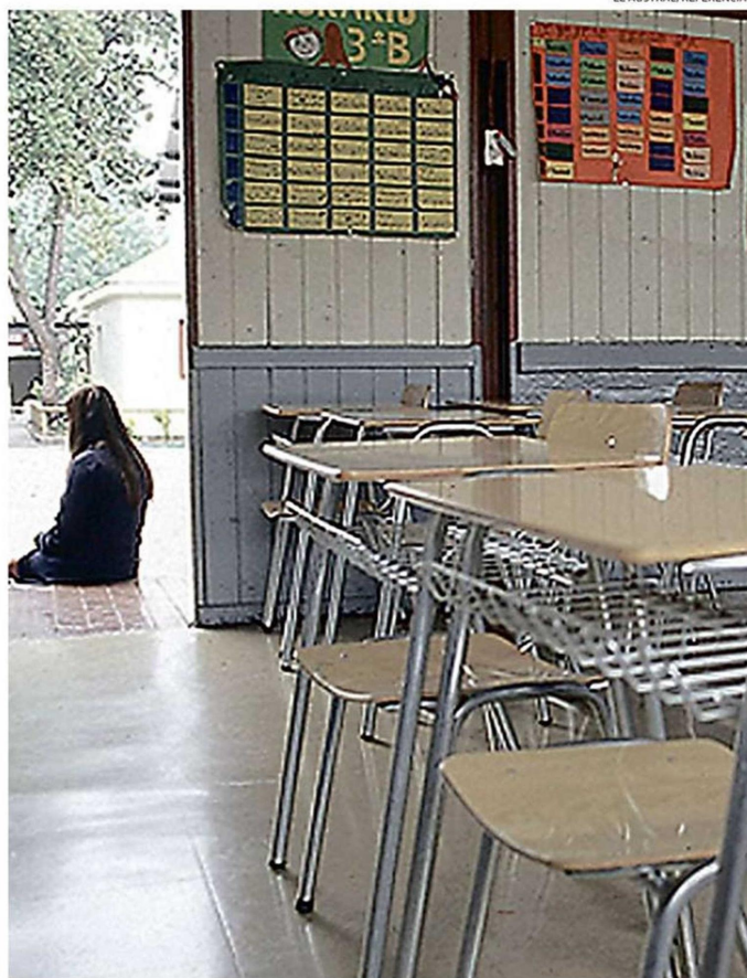
LA ESCOLARIDAD EN LA ARAUCANÍA ES UNA TAREA PENDIENTE TRAS 30 AÑOS DE ESCASOS AVANCES.

"Es necesario avanzar con urgencia en políticas económico-sociales que releven la educación como la vía al de-