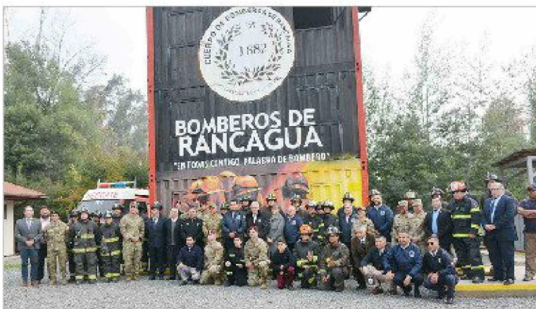
Bomberos de Rancagua junto a los representantes de Estados Unidos.