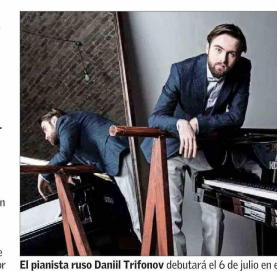
El pianista ruso Daniil Trifonov debutará el 6 de julio en el Teatro Municipal de Santiago.