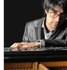
Gustavo Miranda actuará mañana en el Teatro Zóco.