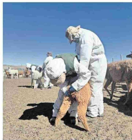
GANADO RECIBE ADEMÁS SUPLEMENTOS VITAMÍNICOS.