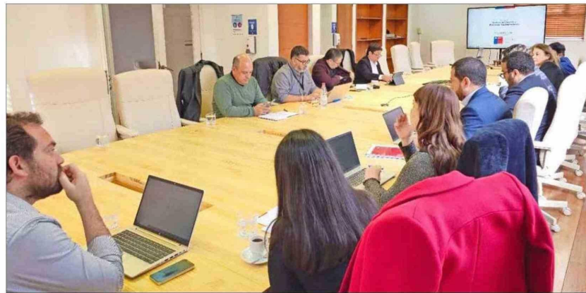
El Gobierno y la CUT han sostenido en los últimos días varias reuniones para tratar de llegar a un acuerdo por el reajuste del sueldo mínimo.

Entre los distintos análisis que hay, un informe de LyD advirtió que considerando el efecto conjunto del alza que ha tenido el salario mínimo respecto de su valor previo a la última ley (variación real de 15,2%), la disminución de una hora a 44 de la jornada laboral y el aumento de 1% de la cotización de la reforma de pensiones que empezará a regir en agosto próximo, el incremento de costos