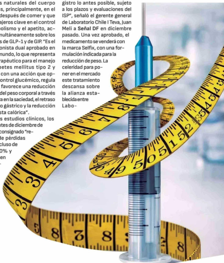
IMAGEN CREADA CON IA