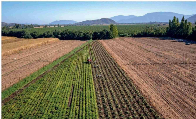
EL SECTOR AGRÍCOLA ES EL SEGUNDO RUBRO con mayor importancia económica, solo después del cobre. Por ello, gremios llaman a destrabar su desarrollo.

El representante de Fedefruta observó también el modelo de desarrollo de países vecinos. Catán cita frecuentemente el