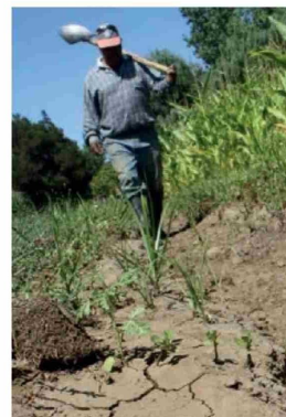
DESDE FEDEFruta LLAMARON a imitar el ejemplo de Perú, que cuenta con políticas de desarrollo agrario a 20 o 25 años.

potenciar este crecimiento se requiere un diálogo más fluido y coordinado con otros ministerios, de modo que se puedan agilizar las inversiones y la inyección de recursos necesarios para la renovación del sector. La meta es clara: lograr que la agricultura chilena sea vista no solo como una tradición, sino como un motor de innovación tecnológica que sustenta el desarrollo de gran parte del territorio nacional.