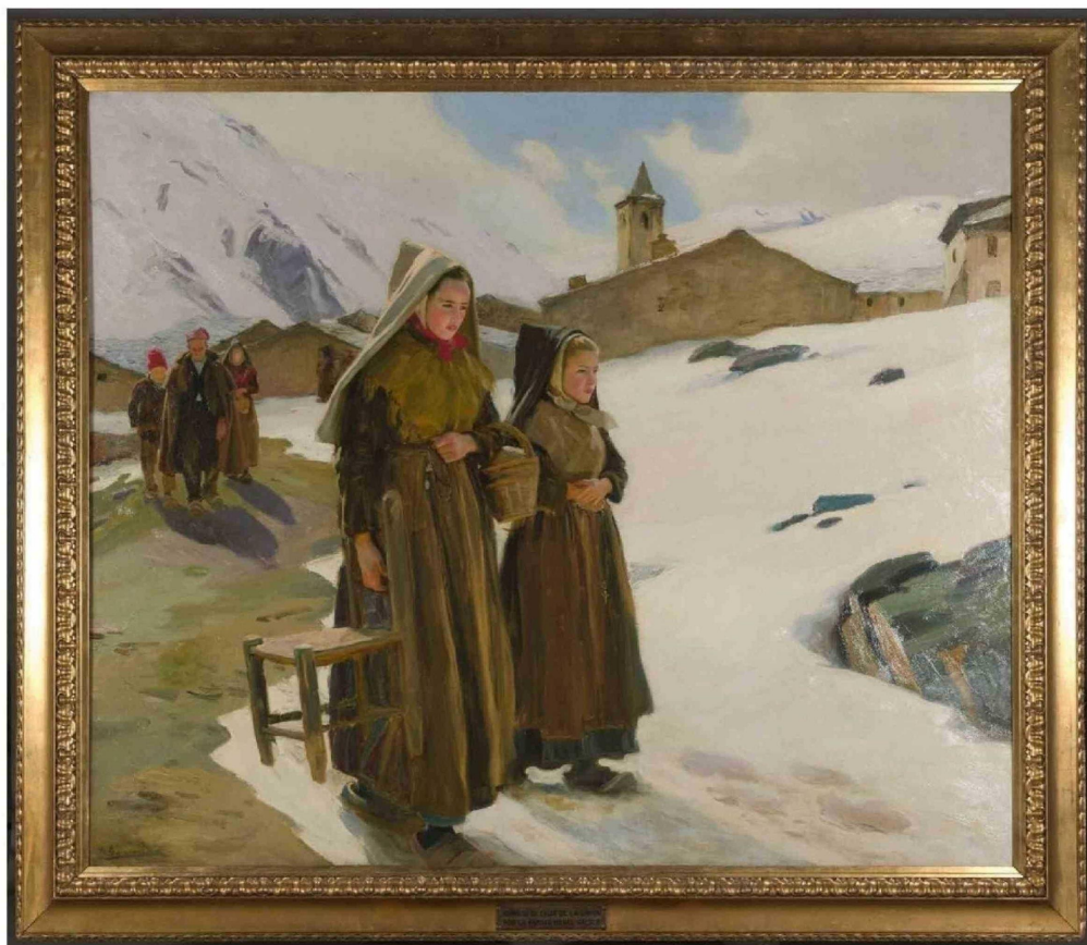
► La inauguración de la muestra es este jueves 9 de abril, a contar de las 18.30 horas, en el Museo Nacional de Bellas Artes.

Desde óleos de 1900 hasta fotografía de los 80 , la institución inaugura este 9 de abril una exposición que revela los criterios y el esfuerzo por modernizar el relato del arte chileno. Su directora habló con Culto sobre esta nueva muestra.