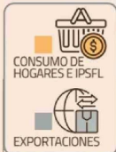
Las exportaciones y el consumo por región en 2025 % VAR ANUAL