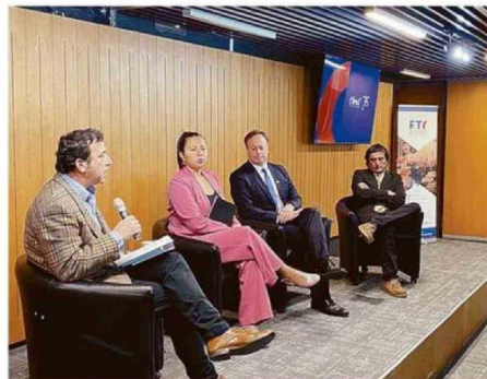
LA INSTANCIA FUE GUIADA POR ACTORES PÚBLICOS Y PRIVADOS.

Entre los motivos que explican el estancamiento de las soluciones habitacionales para este estrato están la baja creación de