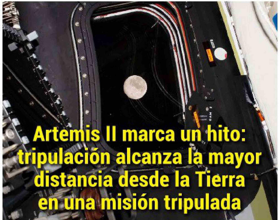
Foto de la Luna desde el Orion