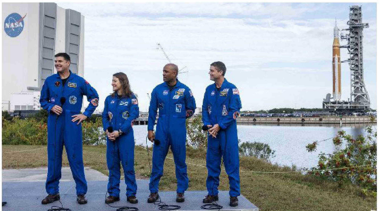
La tripulación del Artemis II, de izquierda a derecha: Jeremy Hansen, Christina Koch, Victor Glover y Reid Wiseman.