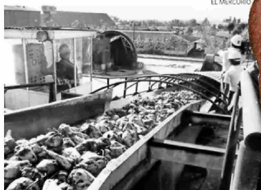
Camiones a la espera de descargar su remolacha en la planta de Iansa en Curicó, en 1985.

Se trata de la primera vez desde la creación de la Industria Azucarera Nacional por parte de Corfo en 1953 que la compañía no utilizará remolacha nacional para la producción