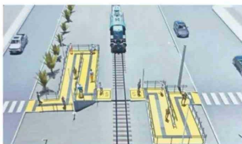
PRIMERA OBRA DE INFRAESTRUCTURA VÍAL FUE APROBADA.

“Este es un proyecto que hemos esperado por años, pero recién se presentó formalmente el 2019 donde tuvo observaciones. Sin embargo, ya se subsanó y se aprobó para este sector, donde hay bastantes adultos mayores porque llegamos aquí el año 1980 a la población que hoy está conformada por 206 viviendas, pero