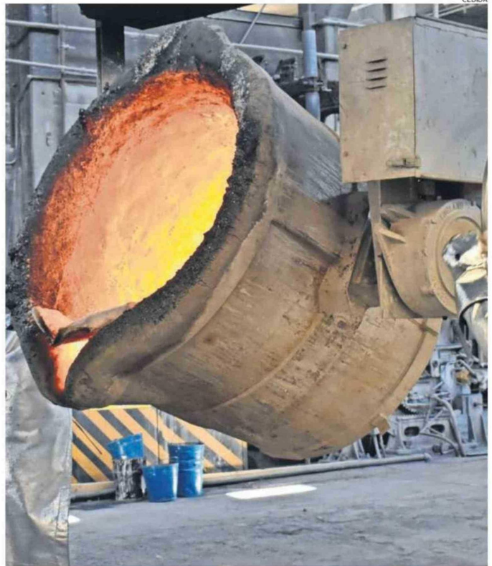
LA MAYORÍA DE LOS PROYECTOS CUPRÍFEROS EN LA REGIÓN APUNTAN A DAR CONTINUIDAD OPERACIONAL.