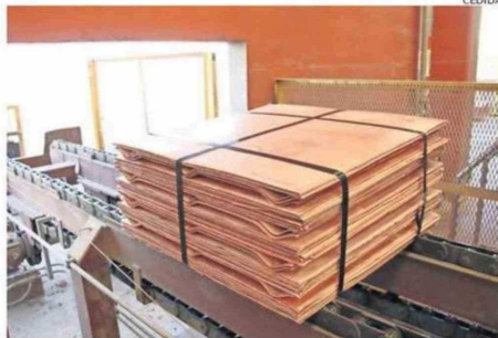
LA LIBRA DE COBRE PROMEDIA US$5,93 EN LO QUE VA CORRIDO DE 2026.

A nivel nacional, el estudio proyecta un comportamiento en tres fases: un crecimiento de corto plazo que llevaría la producción esperada de cobre fino a un máximo cercano a 6 millones de toneladas en 2027; una caída posterior hasta 2030, explicada por el envejecimiento de los yacimientos y la disminución de leyes; y una recuperación gradual hacia el final del periodo, que permitiría estabi-