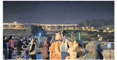
MILES DE PERSONAS LLEGARON A APRENDER.