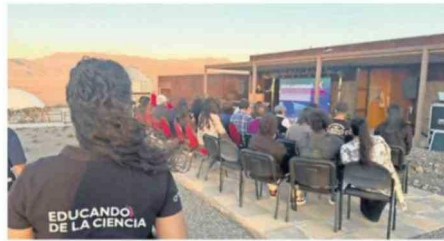
LA ACTIVIDAD TUVO UNA ALTA PARTICIPACIÓN.