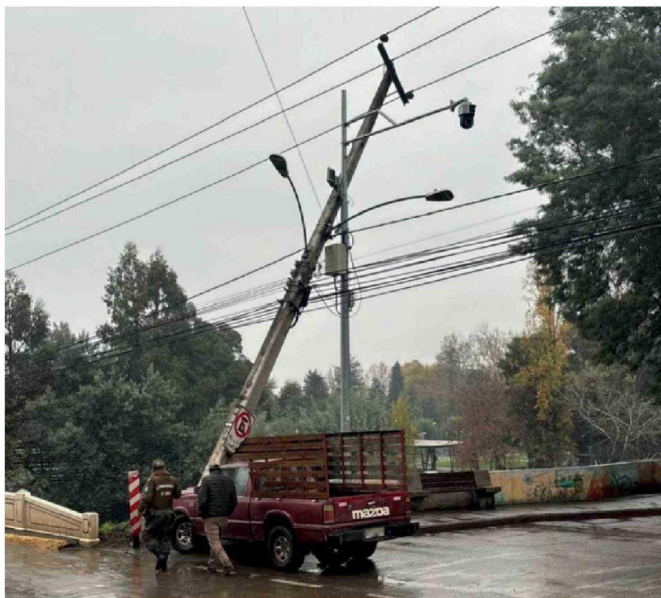
EN MULCHÉN SE REGISTRÓ un accidente de tránsito, lo que obligó a la reposición de un poste en el acceso a la ciudad.

A nivel comunal, los municipios han reforzado sus despliegues preventivos. En Los Ángeles se realizó un Comité para la Gestión del Riesgo de