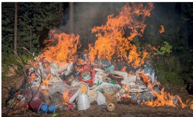
DOS INCENDIOS REGISTRADOS este domingo en microbasurales de Los Ángeles reabrieron la preocupación por los focos ilegales de basura y sus riesgos sanitarios.

Dos emergencias registradas en el sector María Dolores y en el vertedero de Laguna Verde encendieron las alarmas sobre la acumulación de desechos en zonas habitadas. Aunque el Cuerpo de Bomberos logró controlar las llamas, médicos y autoridades advierten la urgencia de erradicar estos focos que actúan como "bombas de tiempo" en el plano sanitario.