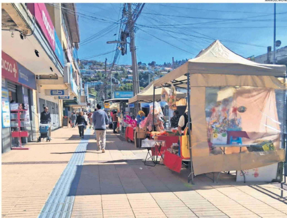
ESTE TIPO DE TOLDOS Y DISPUESTOS EN ESPACIOS DELIMITADOS, ES LO QUE SE PERMITE DESDE AHORA EN AV. COLÓN EN TALCAHUANO.