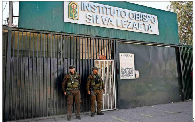
CONMOCIÓN —El Instituto Obispo Silva Lezaeta permanece sin clases tras el ataque, hace ya 10 días.