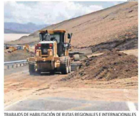
TRABAJOS DE HABILITACIÓN DE RUTAS REGIONALES E INTERNACIONALES

Eso considerando, que "como estamos con alerta temprana, la situación climatológica está siendo bien dinámica, particularmente en el sector cordillerano, donde ya durante todas las últimas jornadas, horarios vespertinos y nocturnos se han registrado precipitaciones