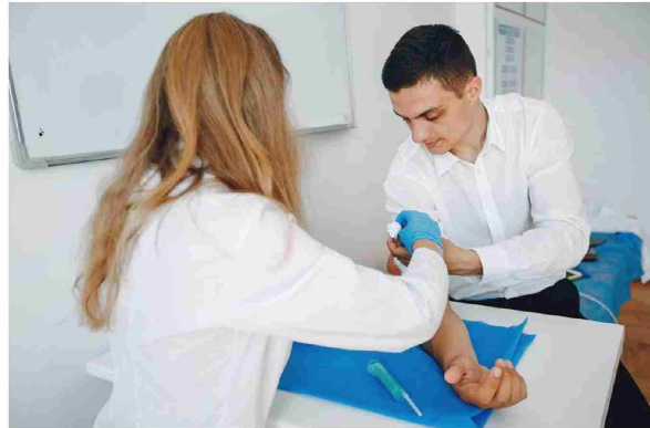
La Sociedad Europea de Aterosclerosis recomienda que los pacientes con un riesgo intermedio, moderado o alto de enfermedad cardiovascular se midan los niveles de lipoproteína A.

"Cuando dispongamos de toda la evidencia científica necesaria, esti-