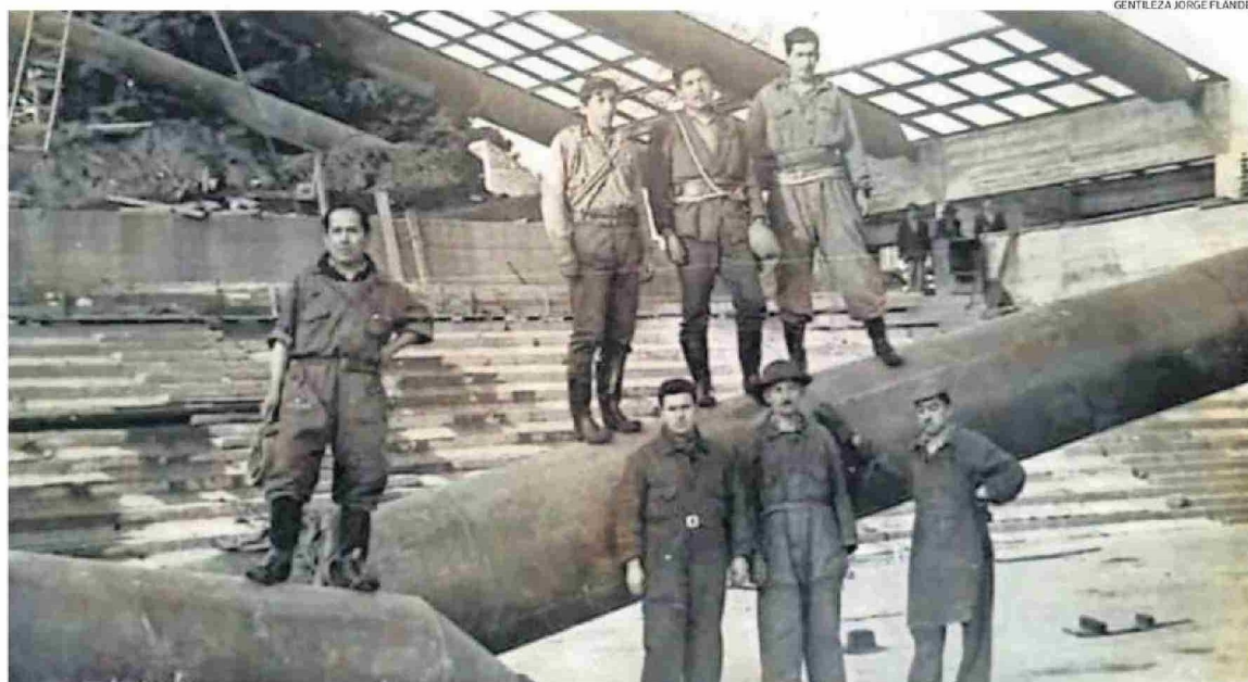
PROCESO DE CONSTRUCCIÓN DEL COLISEO MUNICIPAL EN TERRENOS DONDE ANTES HUBO DOS GIMNASIOS QUE FUERON DESTRUIDOS POR EL TERREMOTO DE 1960.

Luego del gran terremoto del 22 de mayo de 1960, el renacer de Valdivia también fue de-