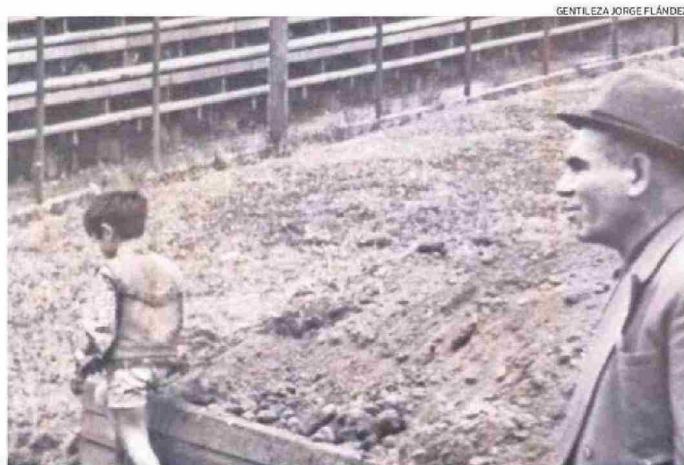
LA PISTA ATLÉTICA DEL ESTADIO MUNICIPAL ALGUNA VEZ FUE DE PASTO Y LUEGO CENIZA.

portivo. El Coliseo Municipal Antonio Azurmendy Riveros fue construido en terrenos donados por la familia Harnecker y donde antes hubo dos gimnasios destruidos por el desastre natural. La nueva e imponente infraestructura debutó en 1965 con el Campeonato Nacional de Básquetbol Juvenil Masculino. Funcionó pese a no tener sus butacas instaladas.