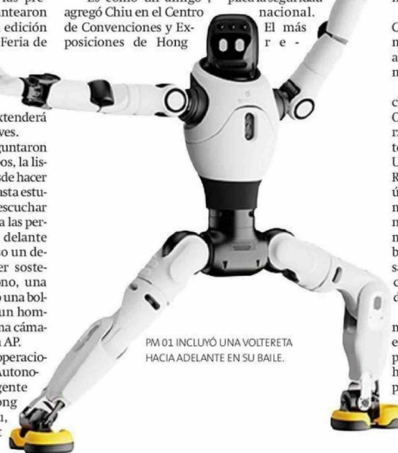
PM 01 INCLUYÓ UNA VOLTERETA HACIA ADELANTE EN SU BAILE.

Con esto se busca cerrar la brecha en "el intercambio de calidez y emoción con el ser humano. Además, (las máquinas) ayudarán a las personas a tomar decisiones y completar sus tareas", sostuvo el representante de la firma cuyo dispositivo supera los US$25.000.