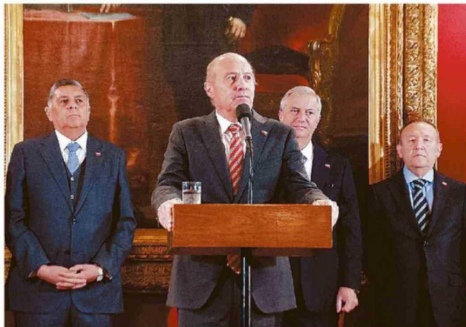
LA FALTA DE COORDINACIÓN INTERMINISTERIAL SE TRADUCE EN MENSAJES CONTRADICTORIOS.

¿Influye en esta lectura que los ministros sean más técnicos que políticos? "Naturalmente era un riesgo al que apostaba Kast a la hora de nombrarlos. Cuando en enero conocimos los nombres de los ministros y ministras, buena parte de estos eran indepen-