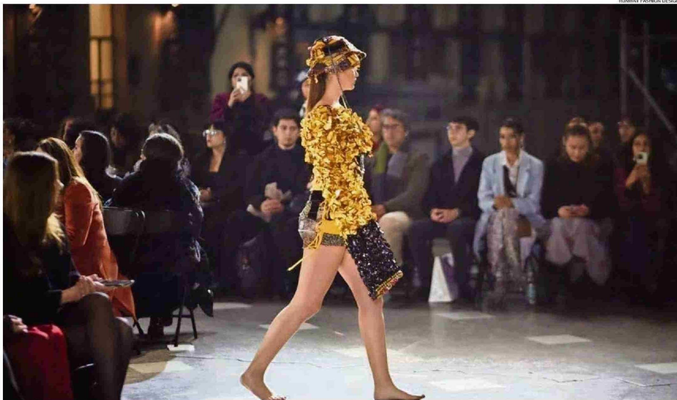
RUNWAY FASHION DESIGN

LA LABOR DE LOS EQUIPOS REUNIDOS EL AÑO PASADO SE CONOCERÁ EL VIERNES PRÓXIMO EN UNA DESFILE CON ENTRADA LIBERADA EN EL AERÓDROMO LAS MARÍAS.