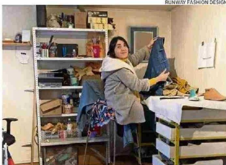
HOY Y MAÑANA SE REALIZARÁ UN SEMINARIO.

“Si bien no existe un seguimiento a los proyectos o marcas una vez que termina el trabajo en la región, RFD las sigue considerando como parte de su comunidad por lo que de alguna u otra manera siempre se le entregará apoyo. Genera esta oportunidad de participar en el programa sin costos per-