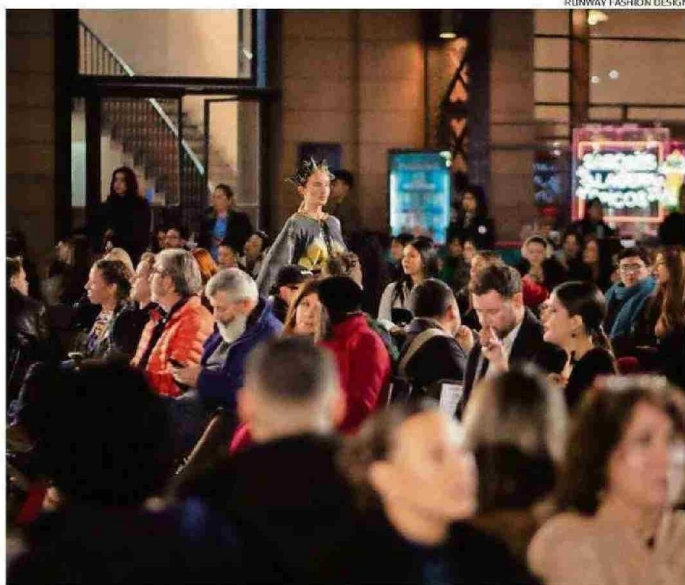
RFD TAMBIÉN SE HA REALIZADO EN LAS REGIONES DEL BIOBÍO Y TARAPACÁ; Y EN SANTIAGO.

son los invitados especiales a la pasarela de RFD Los Ríos: Argentina, Uruguay y Perú. El evento será el viernes en el aeródromo Las Marías.