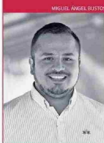
Autor Lorenzo Palma Morales