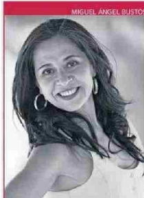
Autora Carolina Erber Soto

L os hongos del bosque crecen en Chile y llegan a lugares distantes, como el reconocido restaurante Boragó en Santiago, donde capturan la atención de los comensales. Ca-