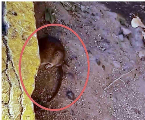
RATONES SE VISUALIZAN EN EL PATIO Y PASILLOS DEL RECINTO.

das, esto se sale de su control, porque esto ya es tema del dueño del sitio colindante, que es un privado y a quien la dirección del colegio ubica”, agregó la apoderada.