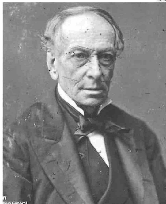
JUAN BAUTISTA ALBERDI, PADRE DE LA CONSTITUCIÓN ARGENTINA, VIVIÓ EXILIADO EN VALPARAÍSO ENTRE 1844 Y 1855.

al respecto el profesor señaló: "Si pensamos en los países antes de su construcción como Estados Nacionales, la relación se inicia desde los trasposos de los mapuches de un lado al otro de la cordillera, los límites son artificiales y surgen con las divisiones de España para luego ser trasposados a las repúblicas. Sin embargo, la campaña libertadora de San Martín abrió una brecha que se consolidó durante el siglo XIX gracias a la migración que provocó la dictadura de Rosas. Estos intercambios se fortalecieron a mediados de esa centuria, aunque se diluyeron durante el siglo XX. Durante este último tiempo, la inmigración ha sido bastante más acotada al ámbito artístico y deportivo. Y, en el caso de nuestra región, la inmigración argentina es clave durante la época estival para el comercio ligado al turismo".