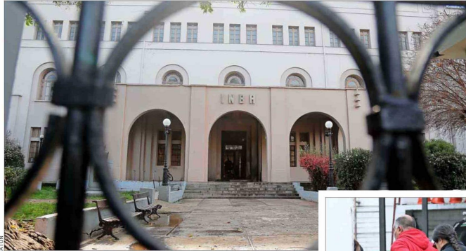
ESCALADA.— El hecho se suma a hechos graves, como la explosión que hirió a 34 alumnos en 2024 y las agresiones a los últimos dos rectores del liceo.

El alcalde de Santiago, Mario Desbordes (RN), sostuvo que el hecho “es completamente inaceptable”, puntualizando que “a los violentistas vamos a perse-