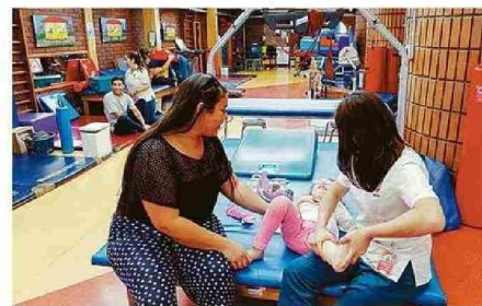
SON 3 MIL 50 PACIENTES LOS QUE SE ATIENDEN EN VALPO.

VISIBILIZAR ESTE 10 Y 11 Reconociendo la tardanza y la escasez de novedades en cuanto a avance, la directora apunta sus espe-